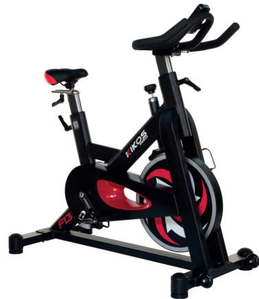
F13 RODA DE INÉRCIA: ATÉ 16 KG PESO MÁX SUPORTADO: 150 KG DIMENSÕES: 123x62x122 CM