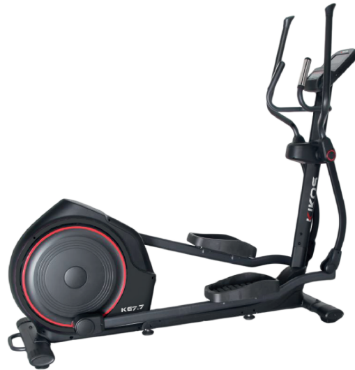
KE7.7 RESISTÊNCIA: 32 NÍVEIS DE TENSÃO TAMANHO DA PASSADA: 50 CM PESO MÁX SUPORTADO: 150 KG DIMENSÕES APROX.: 221x78x179 CM