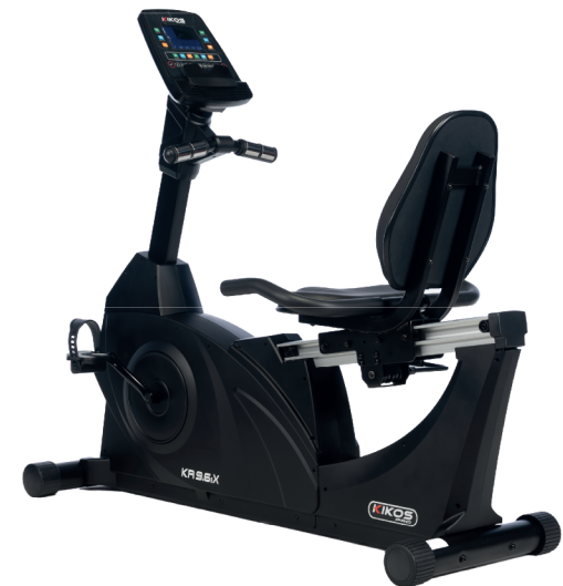
KR9.6IX RESISTÊNCIA: 24 NÍVEIS DE TENSÃO PESO MÁX SUPORTADO: 150 KG DIMENSÕES APROX.: 154x29x71 CM