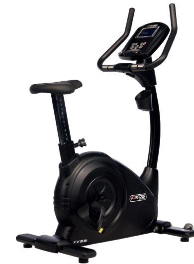
KV9.8I RESISTÊNCIA: 24 NÍVEIS DE TENSÃO PESO MÁX SUPORTADO: 150 KG DIMENSÕES APROX.: 104x64x147 CM