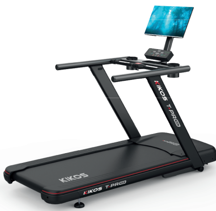
T-PRO RUN MOTOR: 7 HP AC VELOCIDADE: 1 - 20 KM/H PESO MÁX SUPORTADO: 160 KG DIMENSÕES: 220x93x160 CM