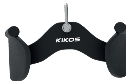
DIMENSÃO: 28X12X14 CM (CXLXA)