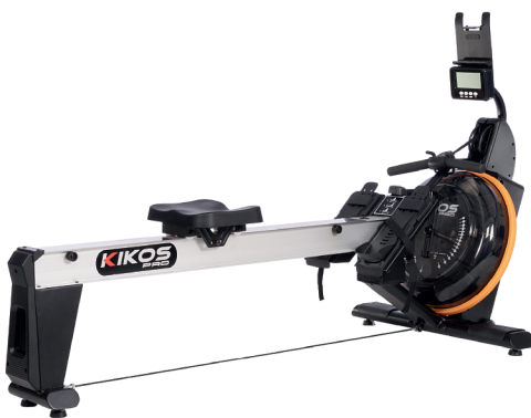
WR200 RESISTÊNCIA: 16 NÍVEIS DE TENSÃO PESO MÁX SUPORTADO: 150 KG DIMENSÕES APROX.: 203x81x100 CM