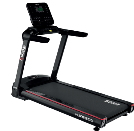
KX8500 MOTOR: 4 HP AC VELOCIDADE: 1 - 22 KM/H PESO MÁX SUPORTADO: 150 KG DIMENSÕES: 194x88x155 CM