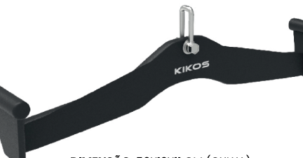
DIMENSÃO: 56X12X11 CM (CXLXA)

COMPOSIÇÃO: CHAPA DE AÇO DE 10mm DE ESPESSURA, E REVESTIDOS COM UMA DENSE BORRACHA TEXTURIZADA