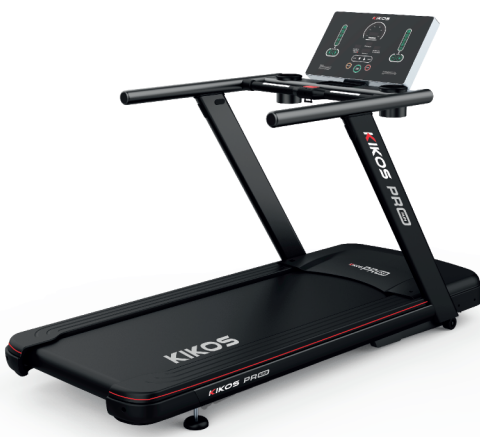
PRO RUN MOTOR: 7 HP AC VELOCIDADE: 1 - 20 KM/H PESO MÁX SUPORTADO: 160 KG DIMENSÕES: 220x93x160 CM