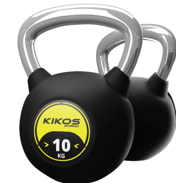
KETTLEBELL RUBBER PRO OPÇÕES DE PESO: 2 - 24 KG COMPOSIÇÃO: AÇO CARBONO EMBORRACHADO