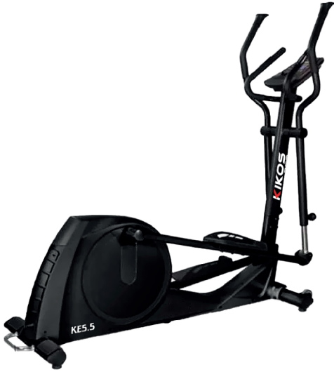
KE5.5 RESISTÊNCIA: 24 NÍVEIS DE TENSÃO TAMANHO DA PASSADA: 45 CM PESO MÁX SUPORTADO: 150 KG DIMENSÕES APROX.: 205x70x178 CM