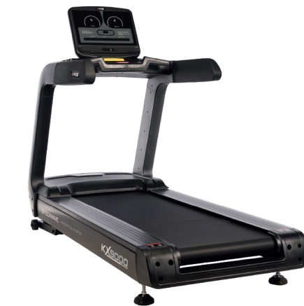
KX9000 MOTOR: 7 HP AC VELOCIDADE: 1 - 20 KM/H PESO MÁX SUPORTADO: 180 KG DIMENSÕES: 214x96x160 CM