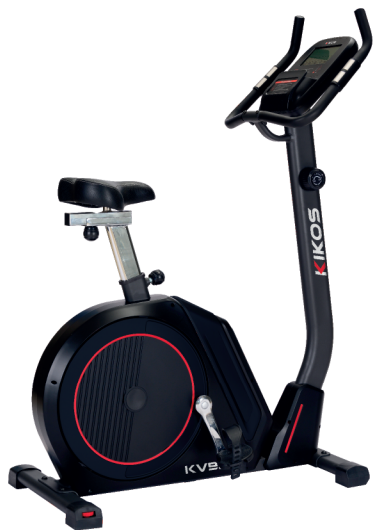
KV9.3 RESISTÊNCIA: 24 NÍVEIS DE TENSÃO PESO MÁX SUPORTADO: 140 KG DIMENSÕES APROX.: 150x120x172 CM