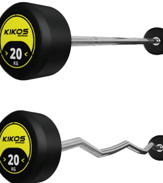
BARRA MONTADA RUBBER PRO OPÇÕES DE PESO: 10 - 50 KG FORMATO: RETO E W | TAMANHO: 1,20 M COMPOSIÇÃO: AÇO CARBONO EMBORRACHADO