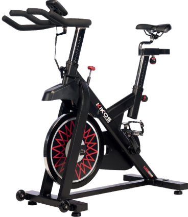
MS2000 RODA DE INÉRCIA: ATÉ 16 KG PESO MÁX SUPORTADO: 120 KG DIMENSÕES: 123x51x119 CM