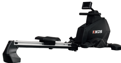
WR100 RESISTÊNCIA: 16 NÍVEIS DE TENSÃO PESO MÁX SUPORTADO: 120 KG DIMENSÕES APROX.: 173x36x53 CM