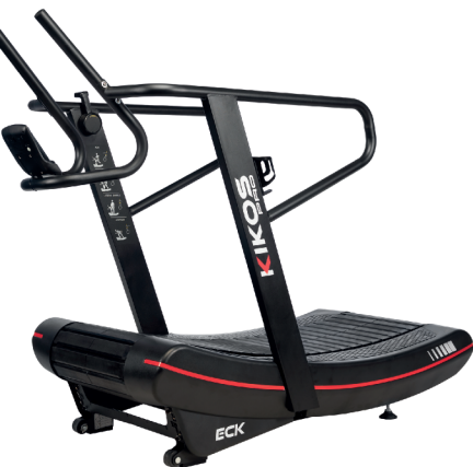
ECK MOTOR: ILIMITADO VELOCIDADE: 1 - 20 KM/H PESO MÁX SUPORTADO: 180 KG DIMENSÕES: 200x90x153 CM