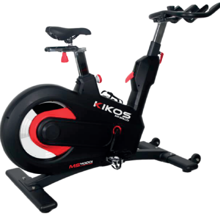
MS4000I RODA DE INÉRCIA: ATÉ 16 KG PESO MÁX SUPORTADO: 150 KG DIMENSÕES: 134x64x113 CM