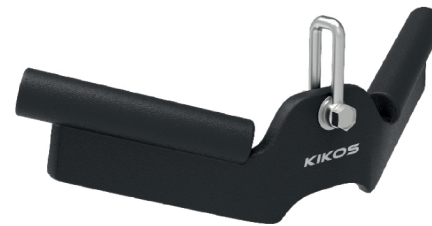
DIMENSÃO: 30X12X7 CM (CXLXA)