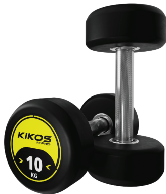
DUMBBELL RUBBER PRO OPÇÕES DE PESO: 10 - 50 KG COMPOSIÇÃO: AÇO CARBONO EMBORRACHADO