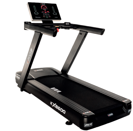
KX8600 MOTOR: 7 HP AC VELOCIDADE: 1 - 20 KM/H PESO MÁX SUPORTADO: 180 KG DIMENSÕES: 218x91x153 CM