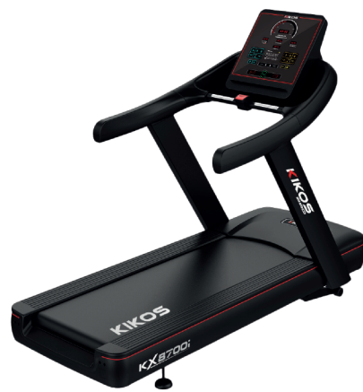
KX8700I MOTOR: 7 HP AC VELOCIDADE: 1 - 20 KM/H PESO MÁX SUPORTADO: 180 KG DIMENSÕES: 216x94x141 CM