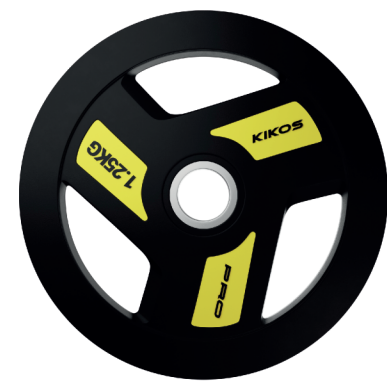
ANILHA RUBBER PRO OPÇÕES DE PESO: 1,25 / 2,5 / 5 / 10 / 15 / 20 KG FURAÇÃO: OLÍMPICA