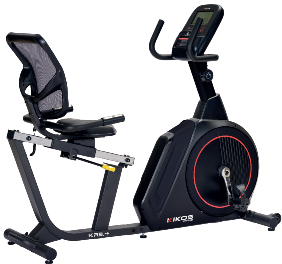
KR9.4 RESISTÊNCIA: 8 NÍVEIS DE TENSÃO PESO MÁX SUPORTADO: 120 KG DIMENSÕES APROX.: 156x59x124 CM