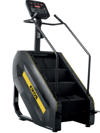
KE17.0 VELOCIDADE: 20 NÍVEIS PESO MÁXIMO SUPORTADO: 150 KG DIMENSÕES: 145x82x208 CM DISPLAY: LED