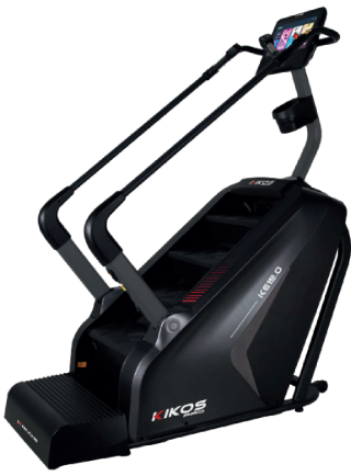
T20.0 / KE19.0 VELOCIDADE: 25 NÍVEIS PESO MÁXIMO SUPORTADO: 150 KG DIMENSÕES: 185x79x211 CM DISPLAY: TOUCH SCREEN / LED