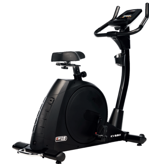
KV9.5IX RESISTÊNCIA: 24 NÍVEIS DE TENSÃO PESO MÁX SUPORTADO: 150 KG DIMENSÕES APROX.: 109x60x148 CM