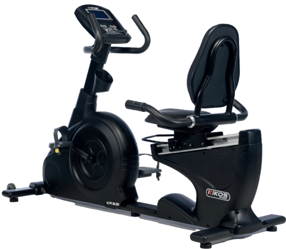
KR9.9I RESISTÊNCIA: 24 NÍVEIS DE TENSÃO PESO MÁX SUPORTADO: 150 KG DIMENSÕES APROX.: 180x66x119 CM