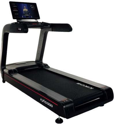
KX10000 MOTOR: 7 HP AC VELOCIDADE: 1 - 20 KM/H PESO MÁX SUPORTADO: 200 KG DIMENSÕES: 214x96x162 CM