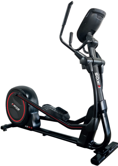
KE15.5 RESISTÊNCIA: 16 NÍVEIS DE TENSÃO TAMANHO DA PASSADA: 50 CM PESO MÁX SUPORTADO: 150 KG DIMENSÕES APROX.: 200x60x170 CM