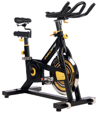
F9 RODA DE INÉRCIA: ATÉ 18 KG PESO MÁX SUPORTADO: 150 KG DIMENSÕES: 103x59x128 CM