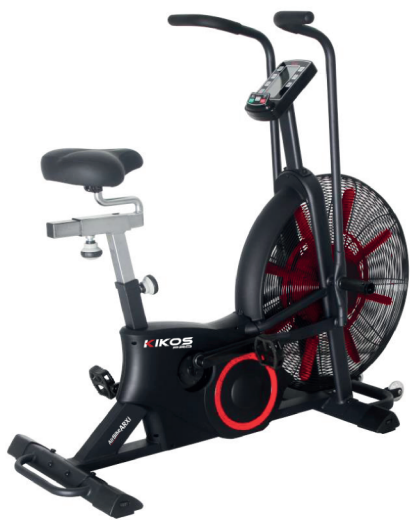
ARXI RESISTÊNCIA: SISTEMA DE AR PESO MÁX SUPORTADO: 150 KG DIMENSÕES: 135x59x130 CM